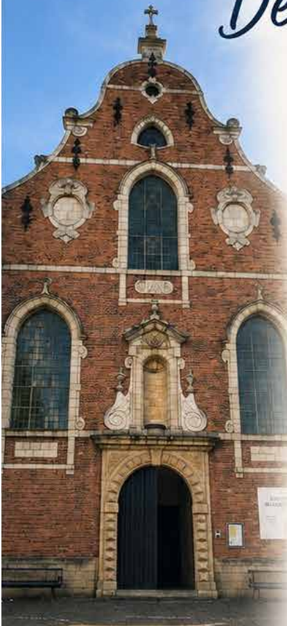
Protestantse Kerk Gent-Centrum Brabantdam

Op onze gemeentevergadering van 12 april hebben de Kerkenraad en de Bestuursraad reeds meegedeeld dat er gesprekken gaande waren tussen de Protestantse Gemeente Horebeke en onze gemeente met het oog op de opstart van een gezamenlijk pilootproject.