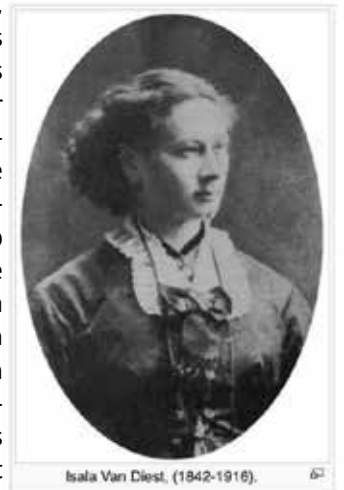
Isala Van Diest, (1842-1916).

Tijdens haar opleiding werd in ons land het voorstel om vrouwen tot het beroep van arts toe te laten nogmaals voorgelegd aan de regering, maar tevergeefs (pas in 1890 werd het beroep opengesteld voor vrouwen). Isala koos ervoor om haar carrière te starten in Engeland waar ze het beroep zonder problemen mocht uitvoeren. Ze werkte er in het Londense New Hospital for women , een medisch consultatiebureau, dat later omgevormd werd tot ziekenhuis. Ondanks haar geldig diploma kostte het Isala nog heel wat moeite (zelf omschreef ze het als een