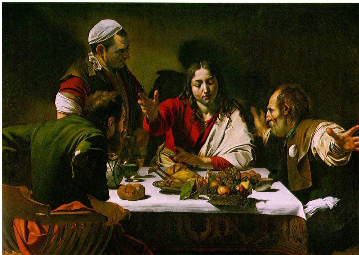
“De Emmaüsgangers (1601)” door Carravaggio